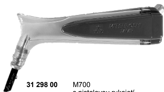
31 298 00 M700 s pistolovou rukojetí