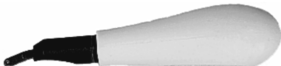
31 125 00 typ Hobby Long Life 424.0, SW 120°, HM, rukojeť z umělé hmoty s nastavitelnou délkou, vhodný pro Tiffany techniku