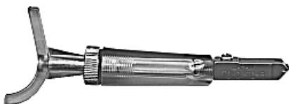
31 163 00 TC 9P Thomasova rukojeť Rainbow v různých neonových barvách

NÁHRADNÍ HLAVY pro všechny TOYO řezáky 31 160 01 úzká hlava