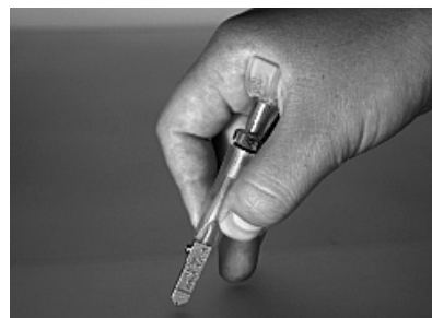
Návod jak řezat s TC 9P

Všechny typy TOYO řezáků mají úhel řezacího kolečka 134°.