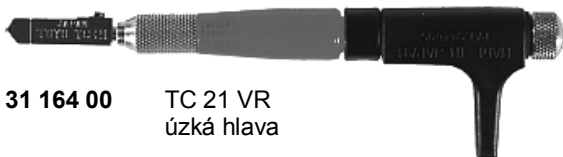
31 164 00 TC 21 VR úzká hlava