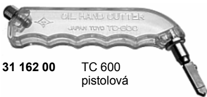
31 162 00 TC 600 pistolová