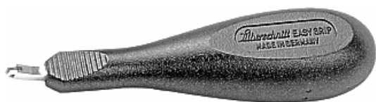
31 127 00 typ Easy Grip 128.01 SW 120°, ST, s prokluzem